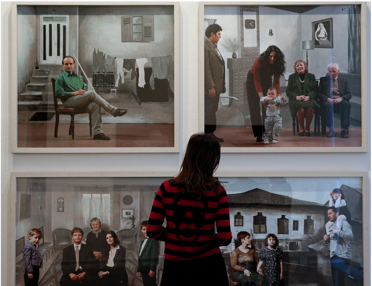
Una perspectiva de la exposición.